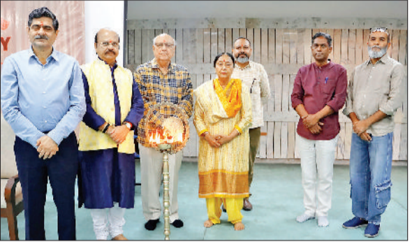
रोहताक। आयोजित कार्यक्रम का दीप जलाकर शुभारंभ के दौरान मुख्यअतिथिगण तथा डीएलसीसुपवा में वर्ल्ड थियेटर डे पर आयोजित नाट्य संवाद व परिचर्चा में पहुंचे अतिथियों का सामूहिक शंखनाद कर स्वागत करते एफटीवी डिपार्टमेंट के छात्र-छात्राएं