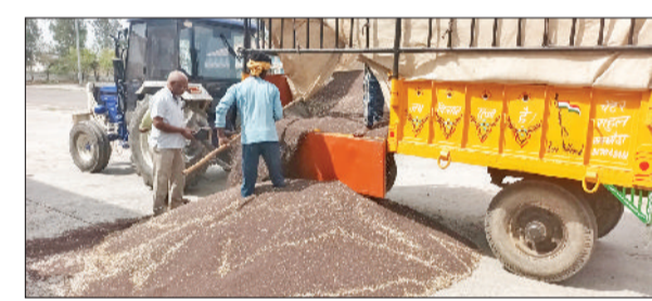
सांपला। अनाज मंडी में निजी खरीद के तहत सरसों बेचते किसान का दृश्य।

रबी फसल खरीद सीजन की शुरुआत के साथ ही सांपला अनाज मंडी में सरसों का अलग ही तस्वीर देखने को मिल रही है। जहां एक ओर सरकार द्वारा समर्थन मूल्य बढ़ाकर किसानों को राहत देने का प्रयास किया गया है, वहीं दूसरी ओर निजी आदतियों द्वारा दिए जा रहे अधिक दामों ने किसानों का रुख अपनी ओर मोड़ लिया है। मंडी में सरसों की आवक शुरू हो चुकी है, लेकिन सरकारी खरीद की बजाय किसान निजी खरीदारों को