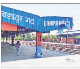
बहादुरगढ़। रेलवे स्टेशन बहादुरगढ़।