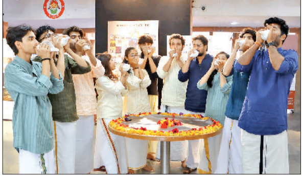
रोहताक। आयोजित कार्यक्रम का दीप जलाकर शुभारंभ के दौरान मुख्यअतिथिगण तथा डीएलसीसुपवा में वर्ल्ड थियेटर डे पर आयोजित नाट्य संवाद व परिचर्चा में पहुंचे अतिथियों का सामूहिक शंखनाद कर स्वागत करते एफटीवी डिपार्टमेंट के छात्र-छात्राएं